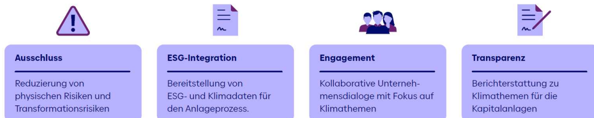
Abbildung 2: Baloise Asset Management Klimastrategie besteht aus 4 Pfeilern

Unsere Klimastrategie besteht aus vier strategischen Pfeilern und ist ein integraler Bestandteil der allgemeinen RI Strategie und somit dieser Richtlinie: